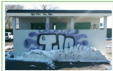
Schmilzt der Schnee bald ganz und gibt unser geliebtes THC frei?

Und wer aktiv werden will für unsere Projekte ist herzlich willkommen!