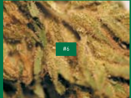
5, Valchanvre Sarl/Martigny, Walliser Queen