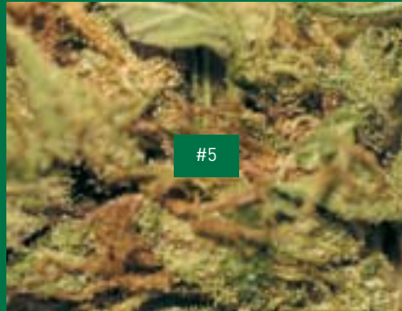
10, TI-Produzent, Heavy Baby