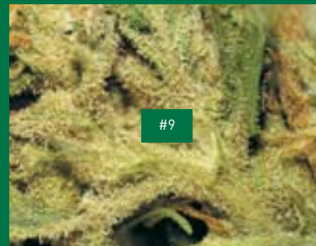
8, Magasin Alp Hemp/Sion, Alp Valley