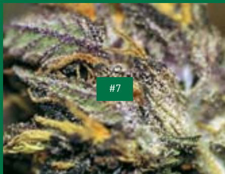
12, BE-Produzent, Pinkfoot