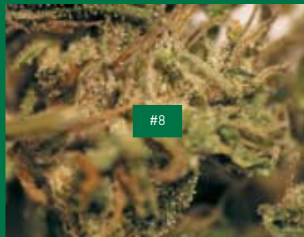
4, BE-Produzent, OB-Green