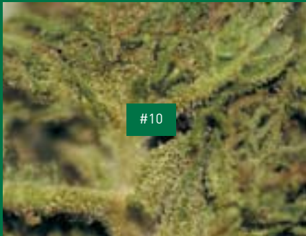
9, LU-Produzent, Bushman