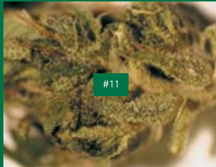
7, BE-Produzent, PCM