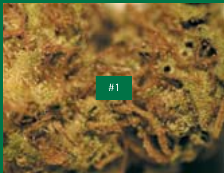
3, Bio Cannabis Ticinese/Someo, Fragola