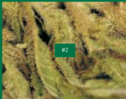
6, Felix Kautz/Ascona, Sky Flight